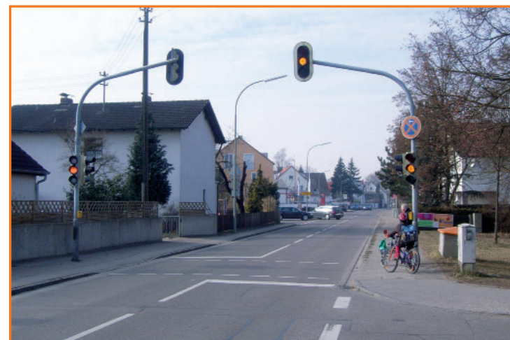
Fußgängerampel in der Weicheringer Straße