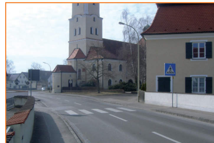
Fußgängerüberweg in der Karlskroner Straße